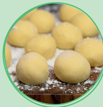
Kluski przed gotowaniem

Ten niezwykły miód nie dość, że pachnie wrzosami, to jeszcze jest gęsty jak galaretką . To jeden z najślodszych polskich miódów.