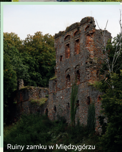
Ruiny zamku w Międzygórzu