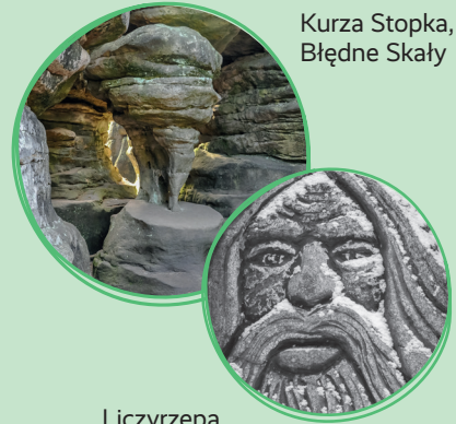
Kurza Stopka, Błędne Skały

BŁĘDNE SKAŁY to niesamowite skalne miasto w Górach Stołowych . Wąskie szczeliny tworzą tam korytarze, przez które trzeba się przeciskać – to jest dopiero atrakcja! Podczas spaceru szukajcie skał o śmiesznych nazwach, np. Kurza Stopka . Podobno labirynt stworzył potężny Duch Gór – Liczyrzepa .