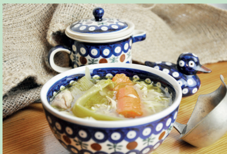
Ceramika z Bolesławca