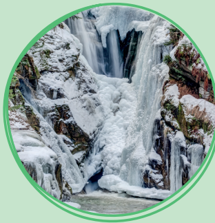
Wodospad Szklarki zimą

WODOSPAD SZKLARKI ma wysokość 13,3 metra, czyli prawie czterech pięter! Wąwóz, w którym znajduje się wodospad, ma 330 milionów lat. W skale obok wodospadu znajdziecie dziwne okrągłe dziury. To marmity – woda drążyła je przez tysiące lat. Do wodospadu prowadzi ścieżka dydaktyczna , która dzięki przystankom edukacyjnym zapozna was z górskimi ptakami i pobliskimi skałami.