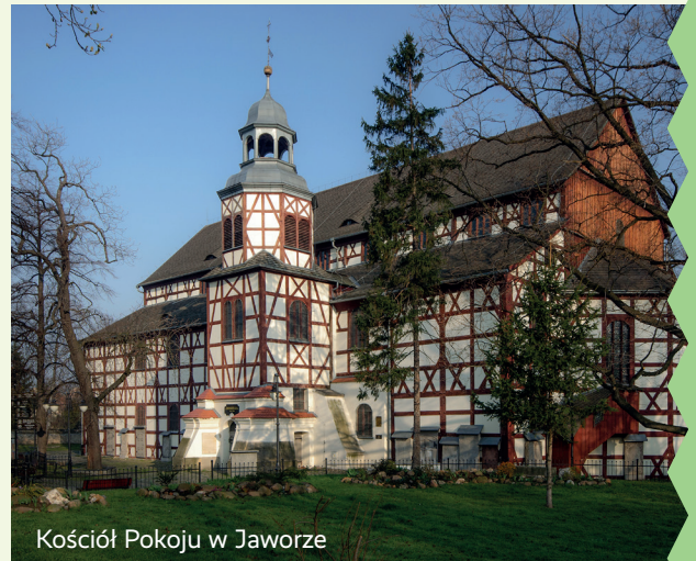
Kościół Pokoju w Jaworze