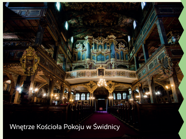
Wnętrze Kościoła Pokoju w Świdnicy