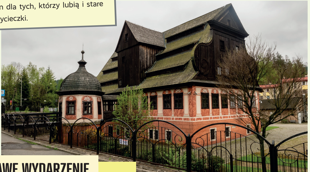
Młyn w Dusznikach-Zdroju